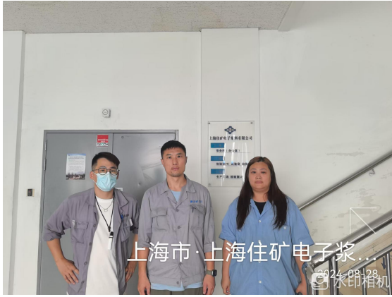
上海市·上海住矿电子浆...