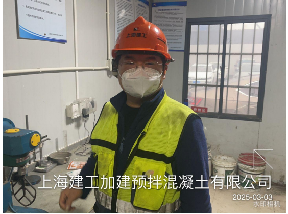
上海建工加建预拌混凝土有限公司