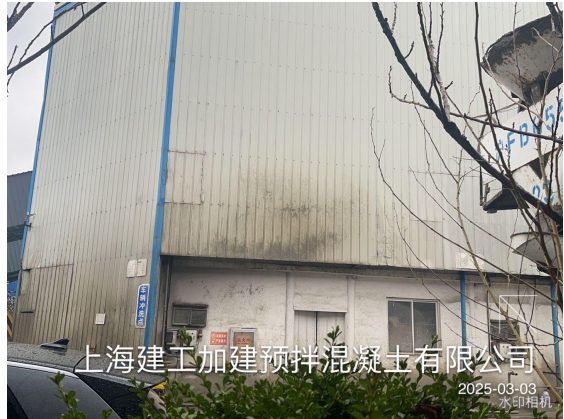
上海建工加建预拌混凝土有限公司