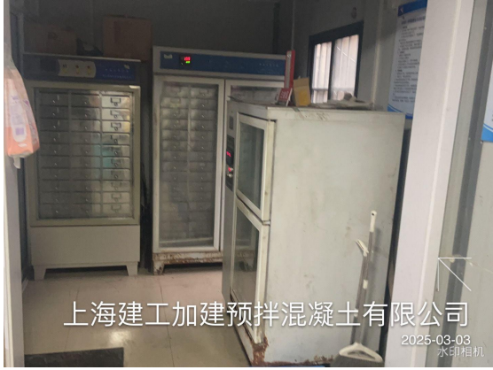
上海建工加建预拌混凝土有限公司