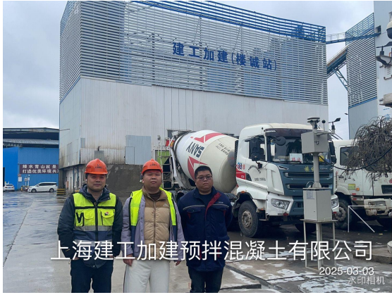
上海建工加建预拌混凝土有限公司