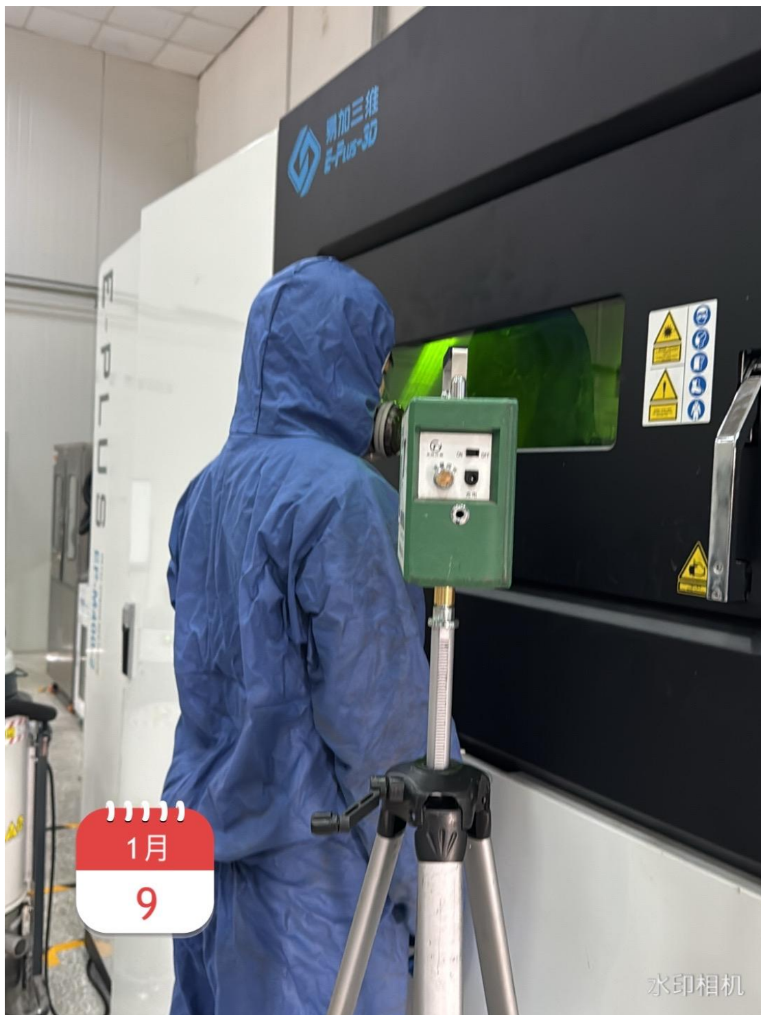
金属 3D 打印操作位