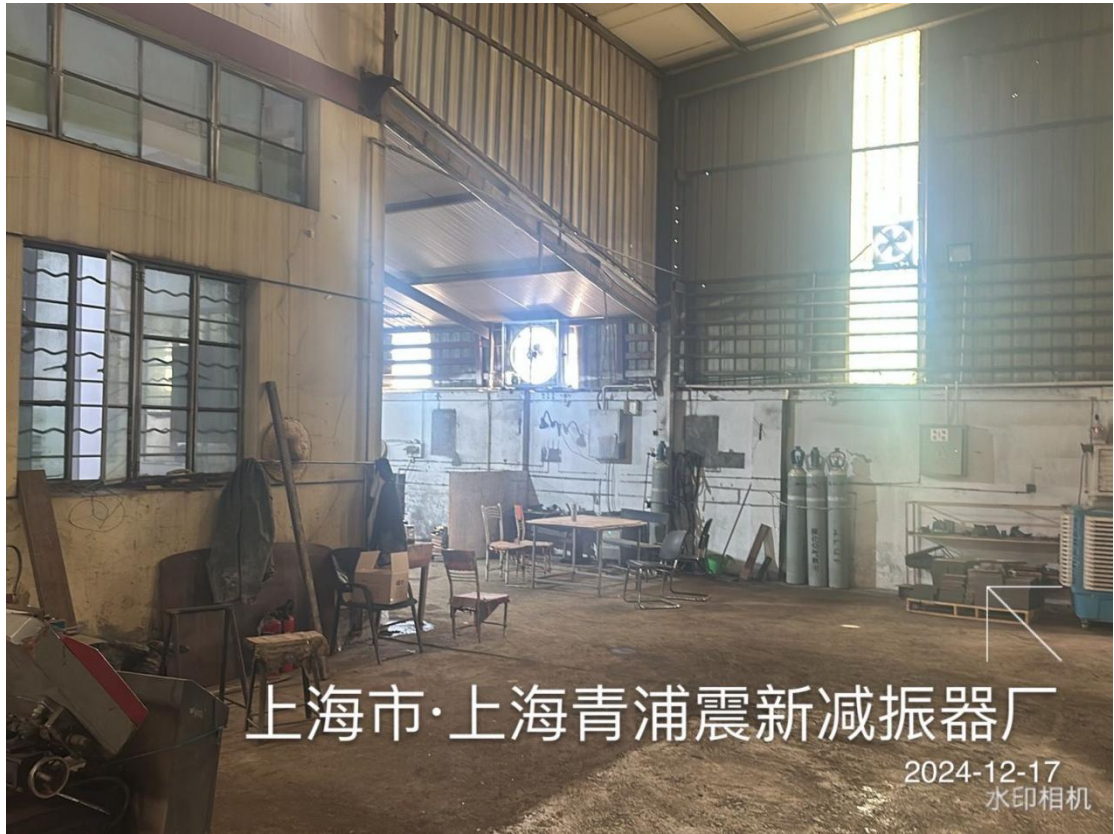
上海市·上海青浦震新减振器厂