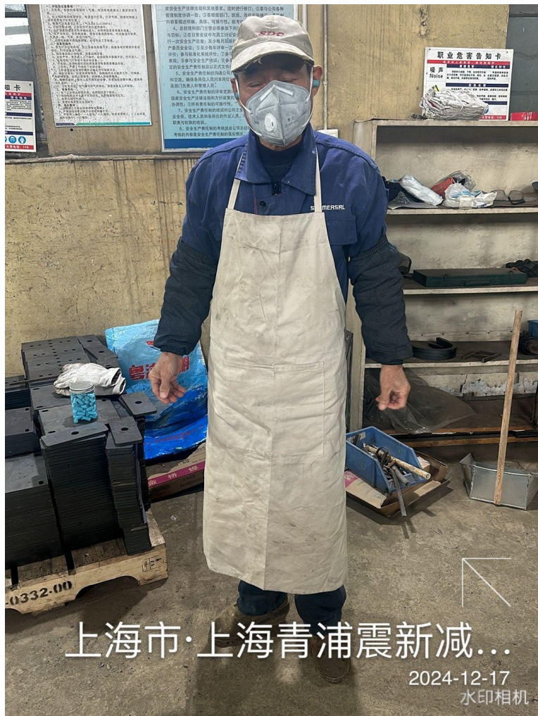
上海市·上海青浦震新减...