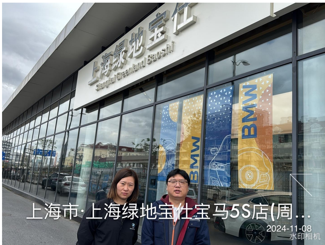
上海市·上海绿地宝仕宝马5S店(周...